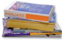
Catalogues, annuaires, livres