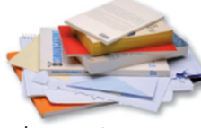
Tous les autres papiers