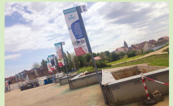
Vu sur la déchèterie de Dampierre